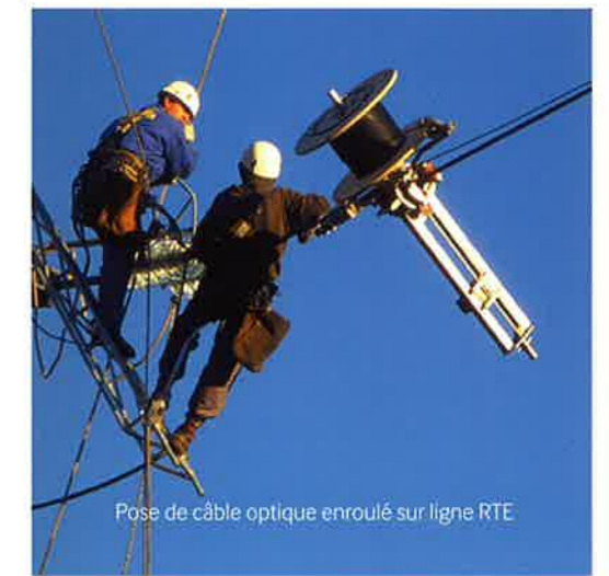
Pose de câble optique enroulé sur ligne RTE

Le réseau aérien de RTE résiste aux agressions de toute nature. Les coupures sont exceptionnelles, y compris lors des phénomènes climatiques de grande ampleur : à titre d'exemple, les tempêtes Klaus (janvier 2009) et Xynthia (février 2010) n'ont généré ni interruption des fibres aériennes ni dommage pour les points hauts. Arteria contribue ainsi à la continuité des services délivrés par ses clients.